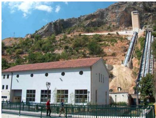
Sl. 4. Strojarnica sa izlazima iz tlačnih tunela: na novom – vodna komora i prijelaz na čelični cjevovod, a na starom - preljev i brzotok

Izgradnja je započeta izgradnjom tunela u listopadu 2001. godine i trajala je do lipnja 2004. godine. Predviđena vrijednost investicije je bila 68 milijuna maraka. Predviđena godišnja proizvodnja HE Peć Mlini je oko 82 GWh.