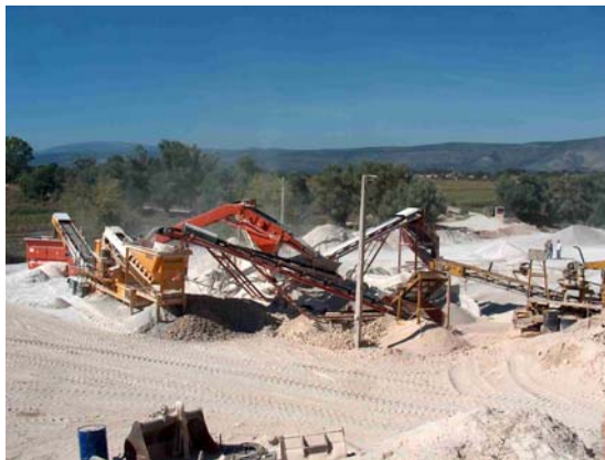
Sl. 5. Separacija "Platica-Otok" Drinovci-Grude

U razdoblju od lipnja 2002. do lipnja 2004. godine ispitano je ukupno 25 uzoraka, što je obrađeno u pojedinačnim izvještajima o ispitivanju agregata.