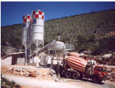
Sl. 6. Betonara GP «Toming» Drinovci-Grude

Ugrađeni beton proizveden je u tvornici betona GP «Toming» d.o.o. Drinovci-Grude, koja se nalazila u blizini, ali izvan gradilišta.