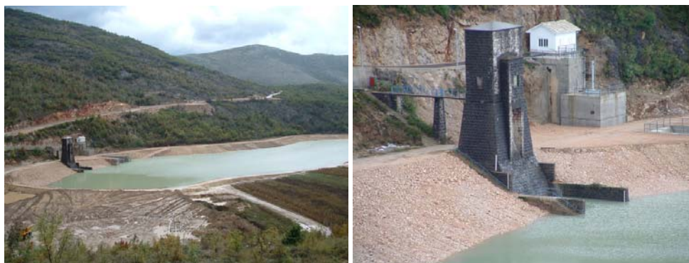
Sl. 1.-2. Nizvodni dio bazena Nuga s uređenim obalama, te starom i novom ulaznom građevinom u podvodne tunele

Na ulazu u novi hidrotehnički-dovodni (betonski) tunel promjera 3,6 m, duljine 1.574 m i kapaciteta 30 m 3 /s, koji je izgrađen paralelno s postojećim na osnoj udaljenosti od 35 m, izgrađena je ulazna građevina (s taložnicom) visine oko 20 m sa rešetkom za čišćenje i tablastim zatvaračem na hidraulični pogon. Izlaz dovodnog tunela završava betonskom samostojećom vodnom komorom , visine 42 m, unutarnjih dimenzija 8,0 x 5,40 m, koja osigurava pouzdanost rada elektrane kod vodostaja u bazenu Nuga od 248 do 263 m n.m. Na vodnu komoru nastavlja se zasunska komora sa sigurnosnim tablastim zatvaračem na hidraulični pogon.