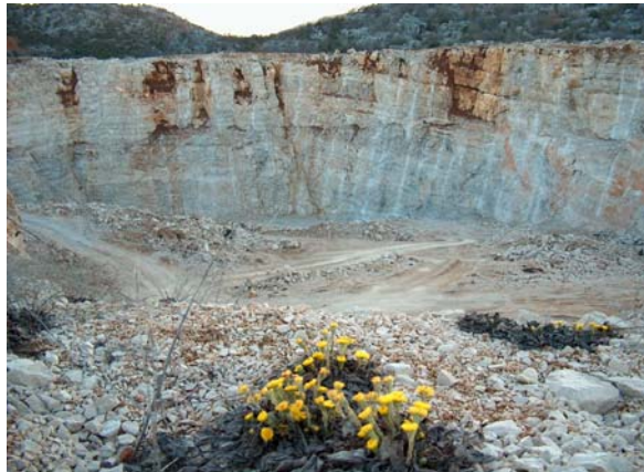
Slike 10.-11. Kamenolomi «Mukoša» kod Mostara i «Crveni Grm» kod Ljubuškog