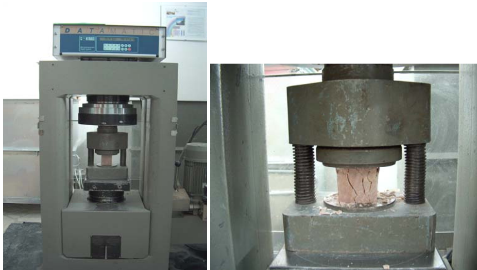
Slike 14.-15. Ispitivanje tlačne čvrstoće, S detaljnom u adapteru za precizno centriranje uzorka (desno)

Ispitivanjem su dobiveni sljedeći rezultati: