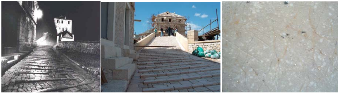
Slike 1.-3. Kaldrma Starog mosta od vapnenca eocenske starosti, s detaljem (desno)