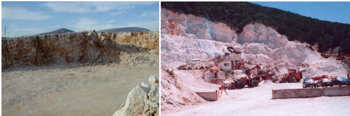
Slike 12.-13. Kamenolomi «Miljkovići» kod Mostara i «Podbor» kod Prozora-Rama

Dolomite eksploataira tvrtka «GRADINA» Prozor-Rama (ležište «Podbor» - zalihe 7,752.612 m 3 ).