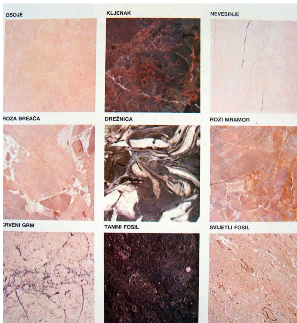
Slika 4. Arhitektonsko-građevno kamenje u Hercegovini